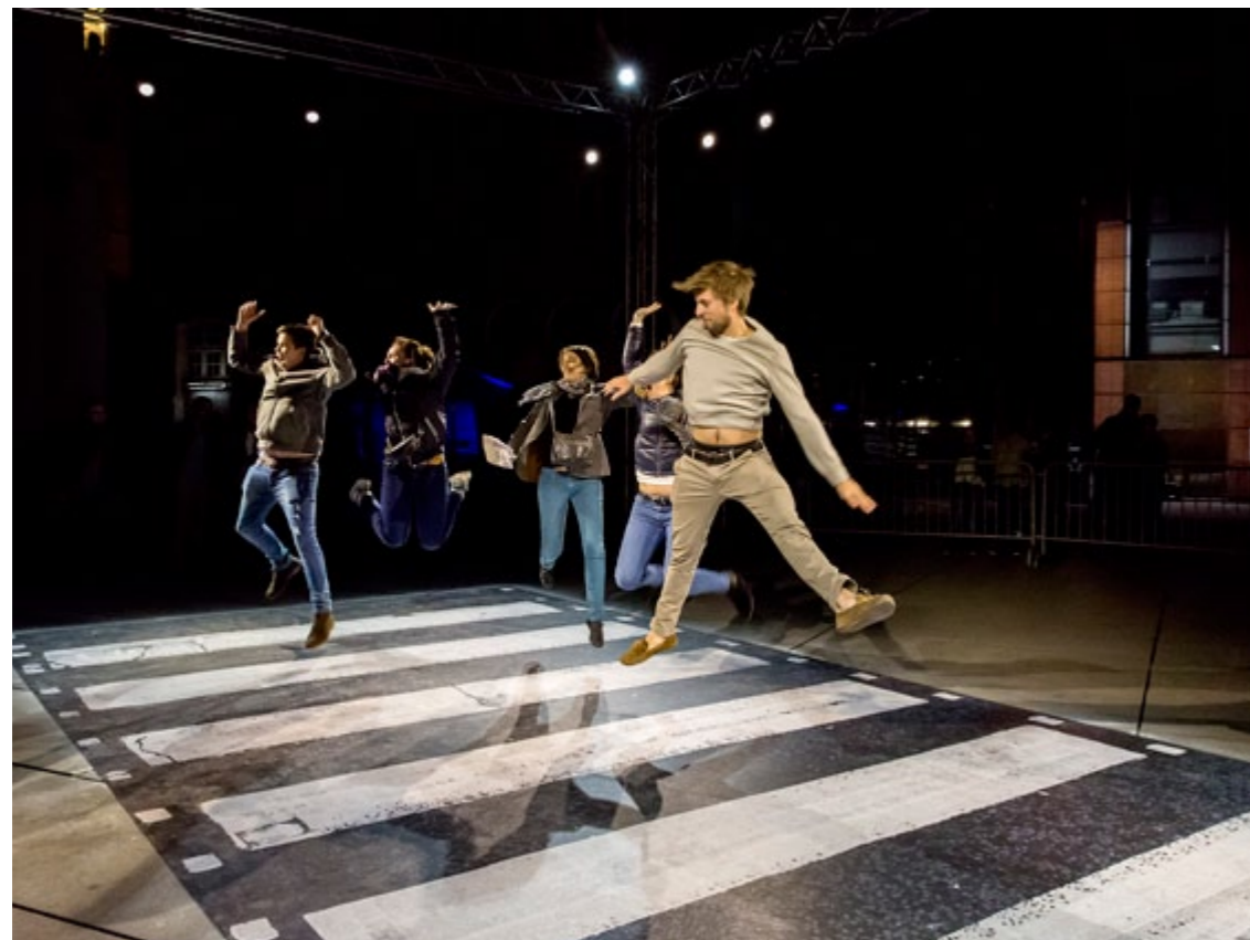
A chacun sa « traversée » pendant la Nuit Blanche Paris Place Igor Stravinsky, 2016

Un concept qui a fait ses preuves pendant la Nuit Blanche 2016, Paris a vu vivre la célèbre scène des Beatles. Plus qu'une photographie, l'oeuvre devient un vrai lieu de rendez-vous, une oeuvre ouverte, participative et réflexive, sur laquelle le spectateur est appelé à s'engager. Cross the Scan - Abbey road fut un réel succès tant auprès du public que des médias.