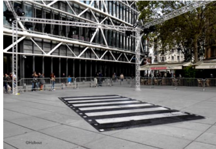
Cross the Scan - Abbey road Centre Pompidou Place Igor Stravinsky, Paris 2016

« Copier/Coller » des lieux mythiques à travers le monde