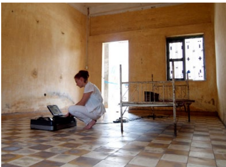
Séance de scan, dans la prison S21, Khmer Rouge, Cambodge Avril 2016