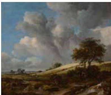
Jacob van Ruisdael Un champ de maïs, avec en arrière-plan le Zuiderzee vers 1660, huile sur toile Rotterdam, Museum Boijmans Van Beuningen