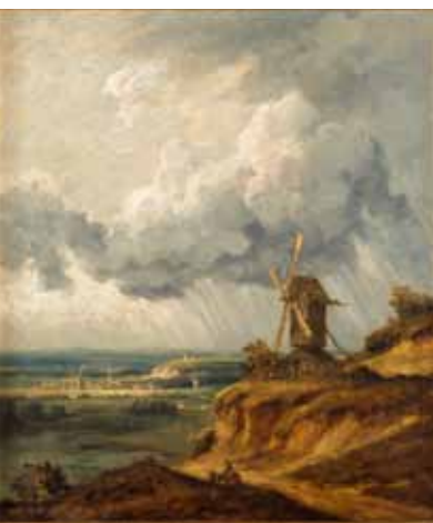
Georges Michel Le Moulin d'Argenteuil vers 1830, huile sur toile Pau, musée des Beaux-Arts