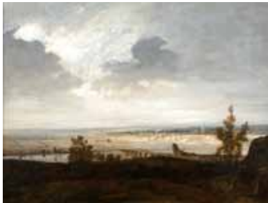
Georges Michel Pont menant à une ville Huile sur toile Paris