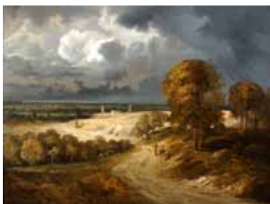
Georges Michel Orage sur la vallée de la Seine Huile sur panneau Collection privée