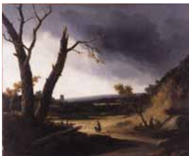
Georges Michel L'Orage 1828, huile sur toile © Toulon, musée d'Art