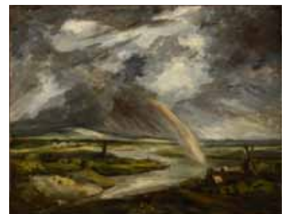
Georges Michel Paysage orageux Huile sur papier, marouflé sur toile Lyon, musée des Beaux-Arts