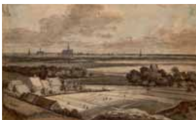
Georges Michel, d'après Jacob van Ruisdael, Paysage de plaine, vue Panoramique (Le Blanchissage dans les champs près de Haarlem) , pierre noire, plume et encre noire, aquarelle