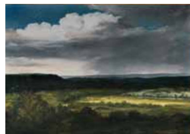
Georges Michel Paysage de collines Huile sur papier, marouflé sur toile Paris, © Fondation Custodia, Collection Frits Lugt