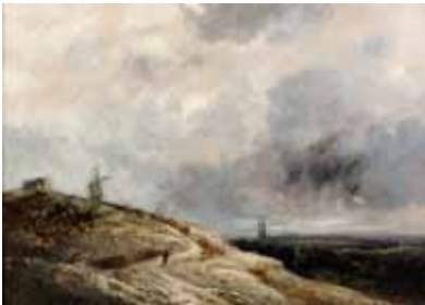
Georges Michel Paysage crayeux au moulin Huile sur papier, marouflé sur toile Collection privée