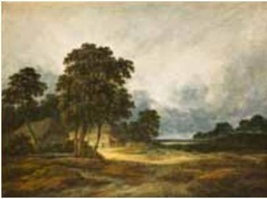
Georges Michel Paysage Huile sur toile La Fère, musée Jeanne d'Abouville