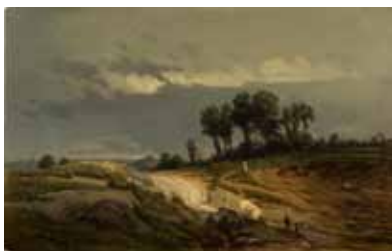
Georges Michel La Sablonnière 1827, huile sur panneau Collection privée