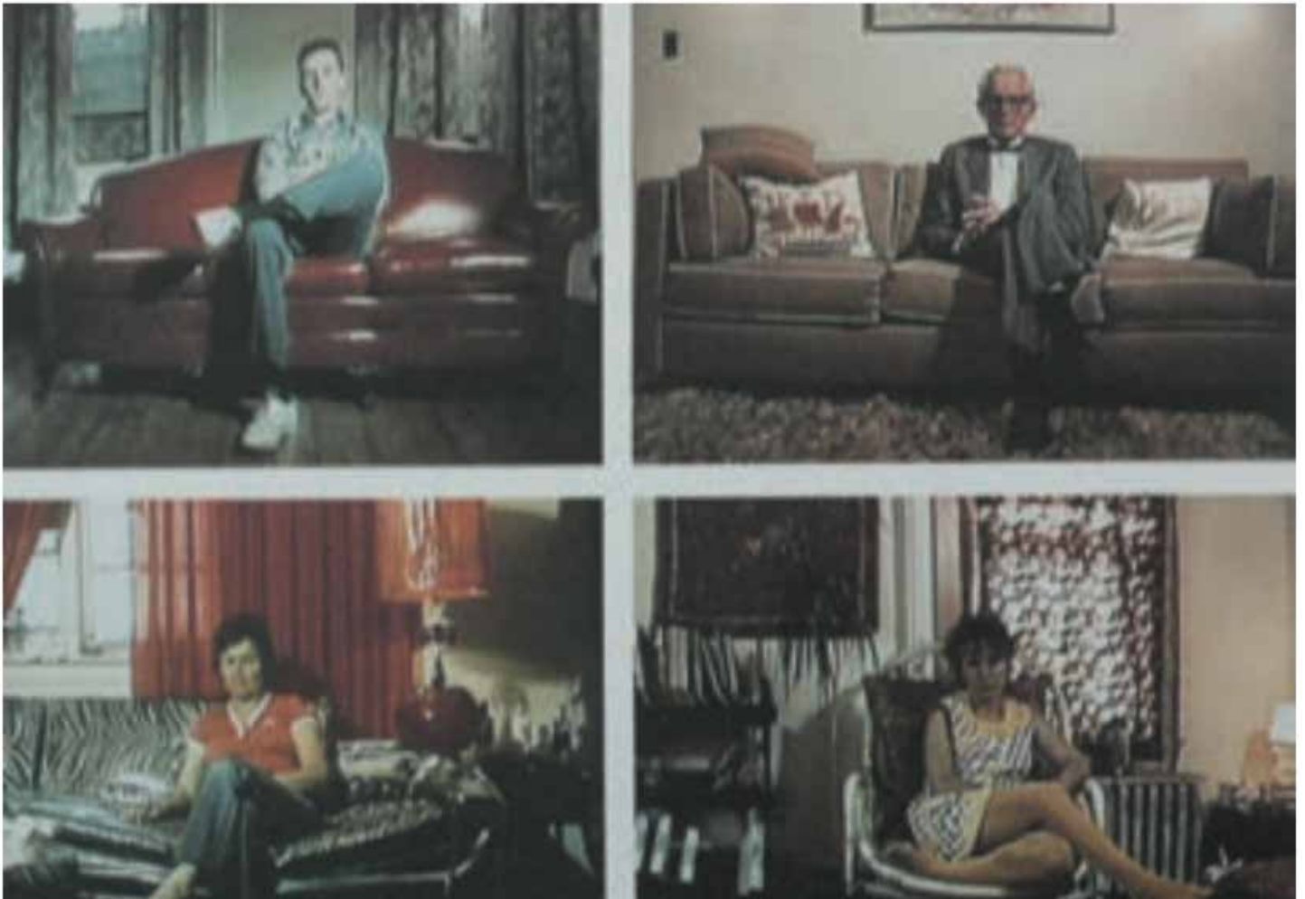
Bill Viola, Reverse Television

“Ces êtres émergent de nos écrans et de nos interfaces et, non sans provoquer un certain vertige perceptif, bouleversent l'idée que nous nous faisons de ce qui est réel.”