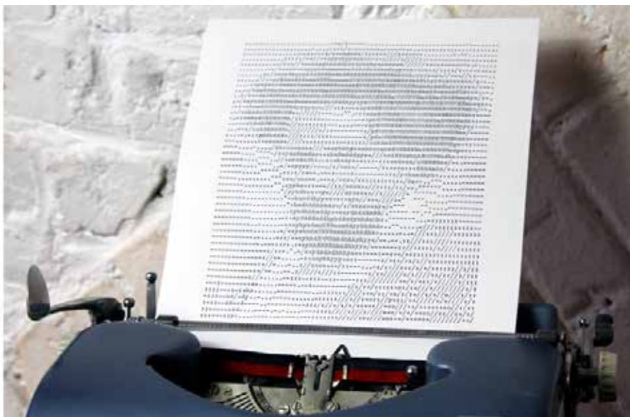
Sébastien Hildebrand, Figures de Style