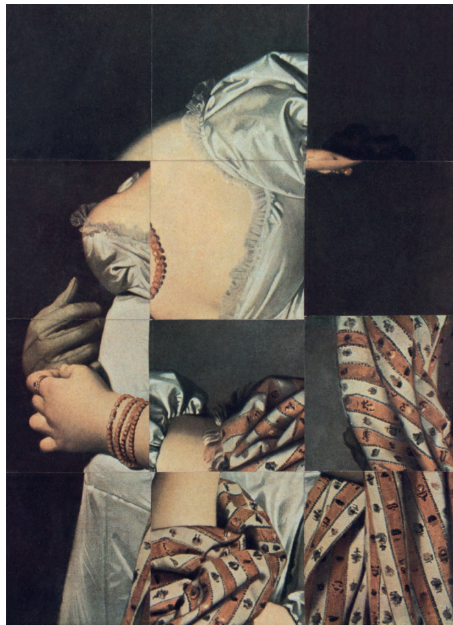
Ghèrasim Luca, Cubomanie, Melle rivière d'après Ingres , sans date. © Micheline Catti - Gherasim Luca

Le fonds inclut également des œuvres sans auteurs connus d'Europe, d'Afrique, d'Océanie.