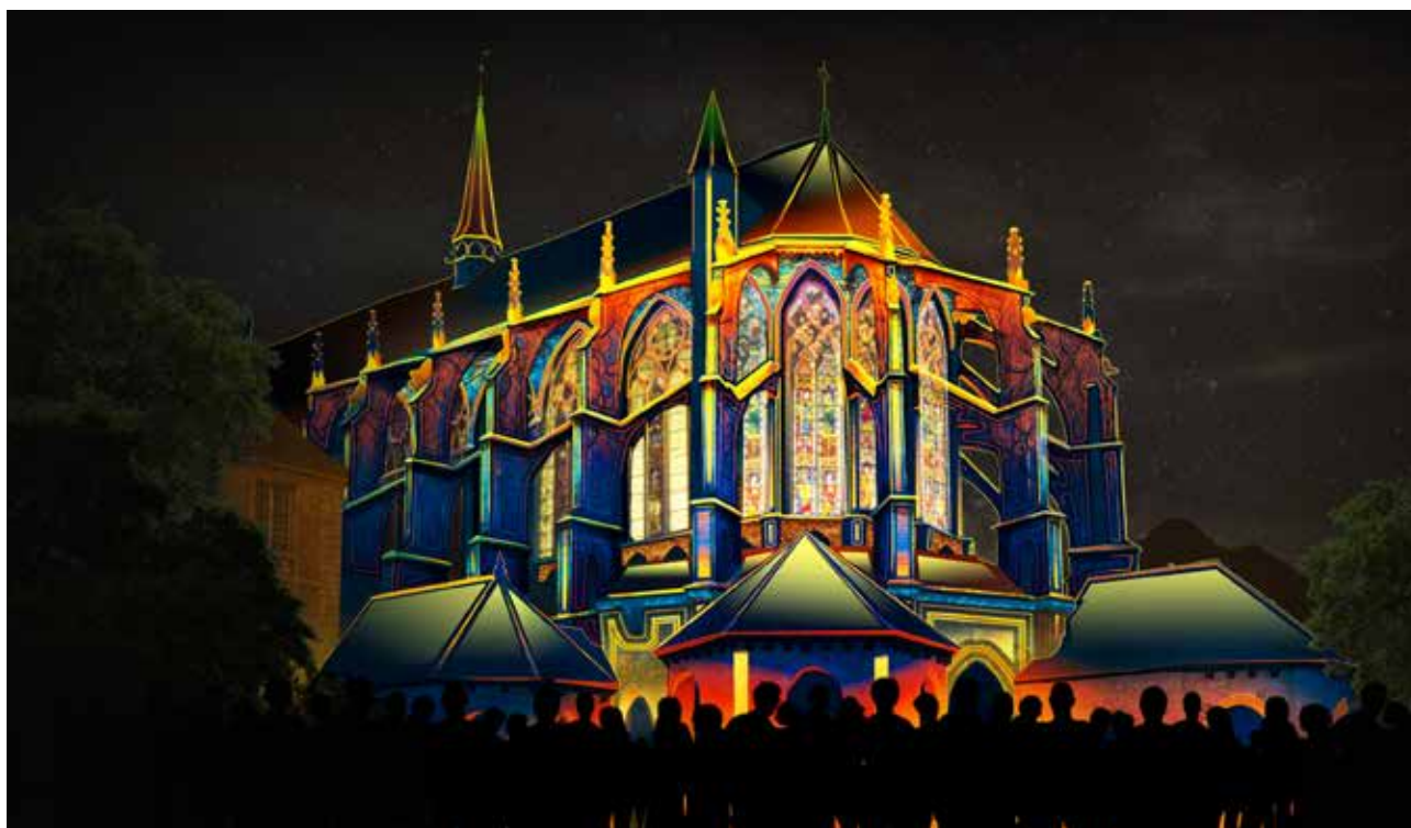
Eglise Saint-Pierre © BK_Digital_Art_Company Illustration projet