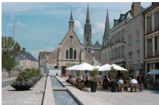
Chapelle Sainte-Foy

Chartres en lumières fait partie d'une volonté de redynamisation globale de la ville, sous tous ses aspects, et grâce à une synergie entre toutes les compétences municipales.