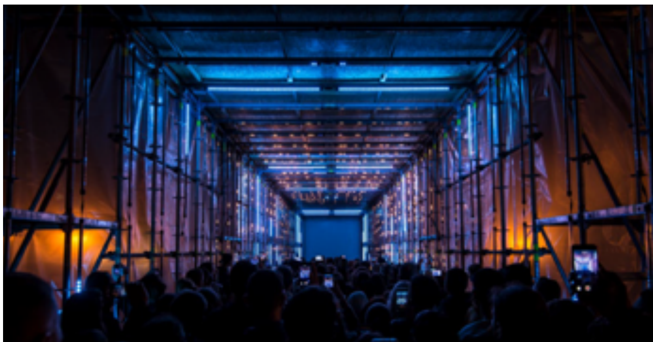
Beyond, Fête de la Lumière 2019 Compagnie : Playmodes

Samedi 19 septembre, de 21 h à 1 h. Une programmation totalement gratuite.