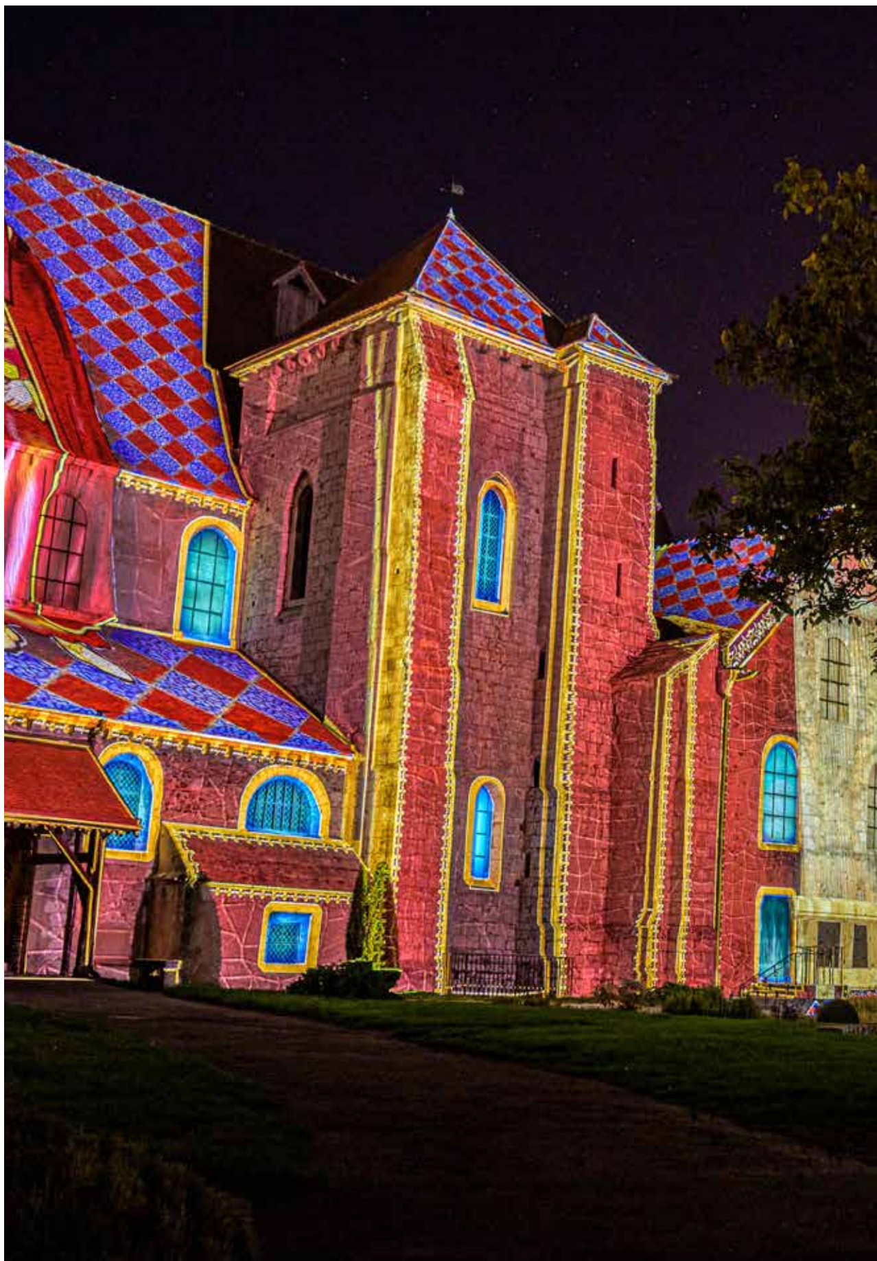
Collégiale Saint-André Scénographe : Les Orpailleurs de lumières © Ville de Chartres - Groupement Martino © Les Orpailleurs de lumières