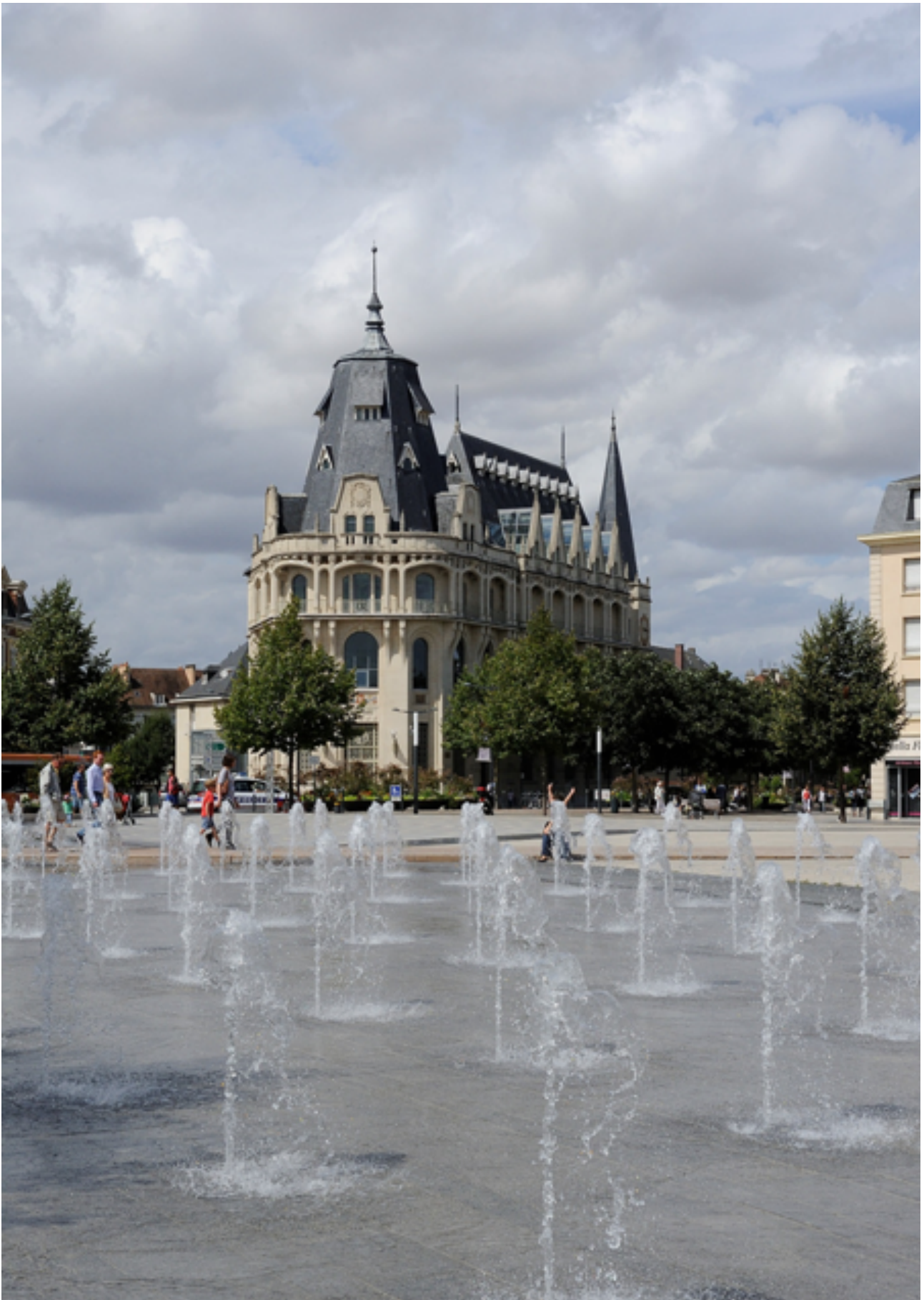
Place des Epars, Chartres