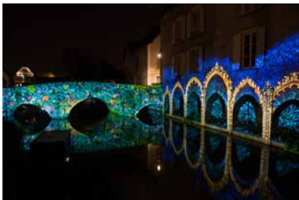
Arcades et pont Saint-Hilaire