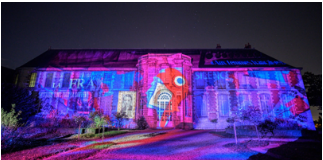
Façade d'honneur du musée des Beaux-Arts Scénographe : BK Digital Art Company