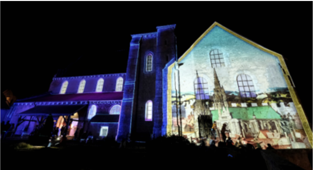
Collégiale Saint-André Scénographe : Les Orpailleurs de Lumière © Ville de Chartres-Groupement Martino © Les_Orpailleurs_de_Lumière