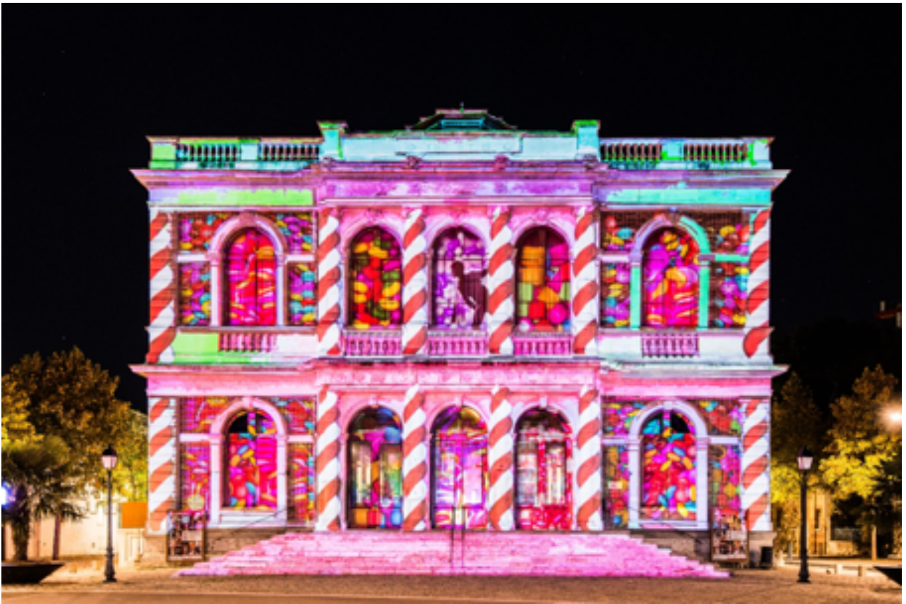
Théâtre de Chartres Scénographe : Marie-Jeanne Gauthé © Ville de Chartres - Groupement Martino © Marie-Jean_Gauthé