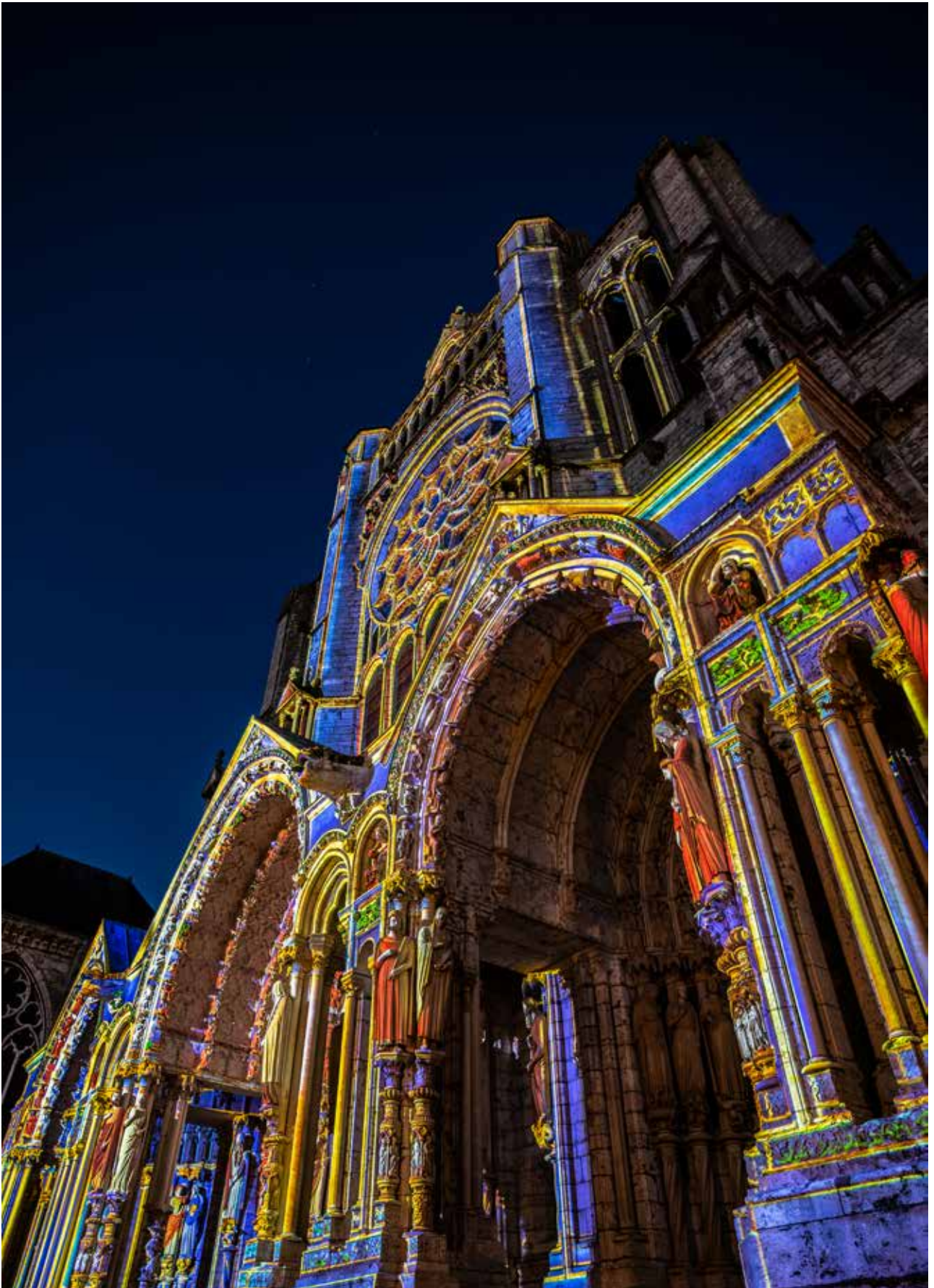
Portail nord de la cathédrale Scénographe : Spectaculaires, Allumeurs d'images © Gojira photographie © Spectaculaires, Allumeurs d'images