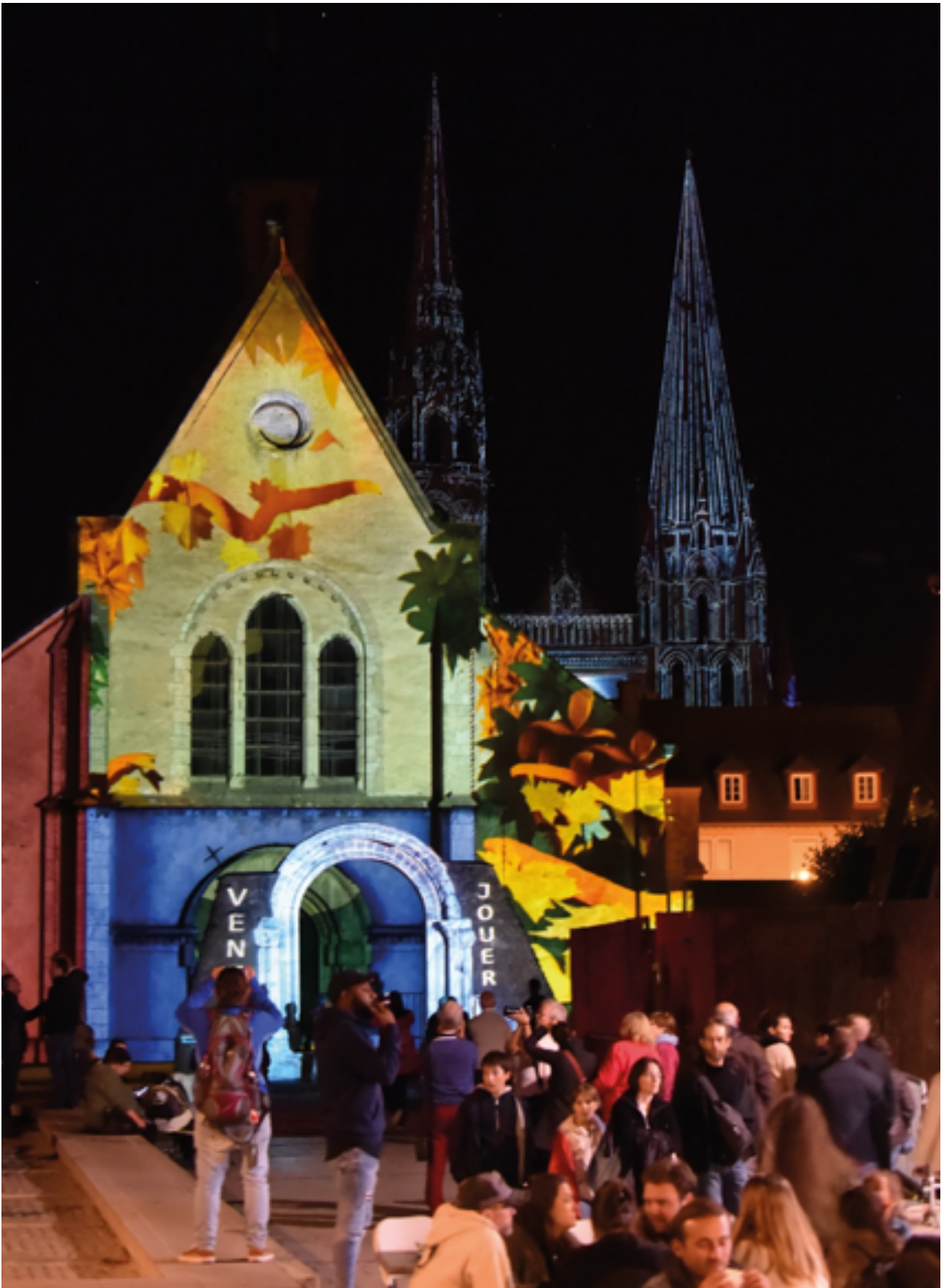
Chapelle Sainte-Foy et portail royal de la cathédrale

Scénographes : Pxl'n'Pepper et Spectaculaires, Allumeurs d'images