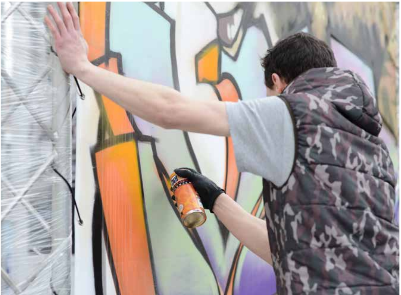
Boulevard du graff 2018, Chartres

gence de qualité, prévue pour tous les âges et pour satisfaire les néophytes comme les amateurs plus avertis. Les Chartreains et les visiteurs peuvent ainsi profiter de leur ville et sont invités à en partager les temps forts en toute convivialité.