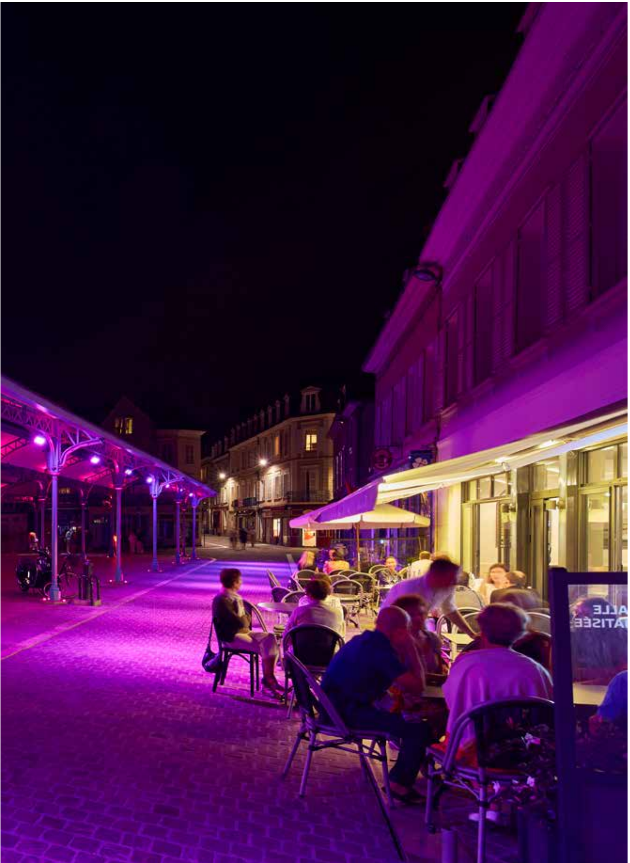
Place Billard