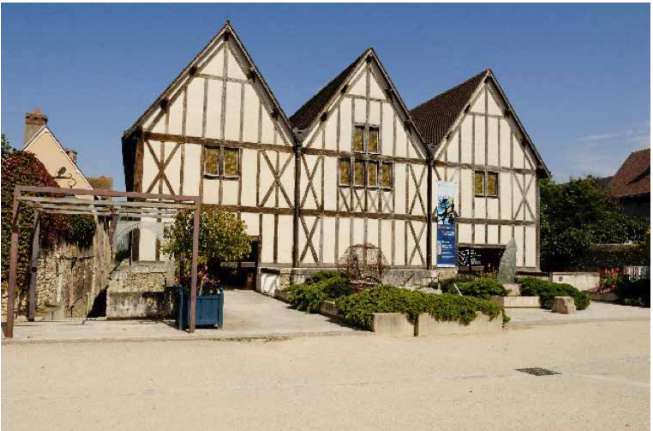
Centre international du vitrail

Situé dans une ancienne grange aux dîmes, il réunit une école internationale de formation à l'art du vitrail, un musée présentant une collection permanente issue des églises de la région, et des expositions temporaires orientées sur le travail du vitrail par les artistes contemporains actuels, traité comme un art à part entière. Une salle pédagogique complète la visite avec la présentation de l'ensemble des verrières de la cathédrale de Chartres, sous forme de maquettes et de schémas explicatifs. Le Centre international du vitrail forme professionnellement des maîtres verriers du monde entier chaque année.