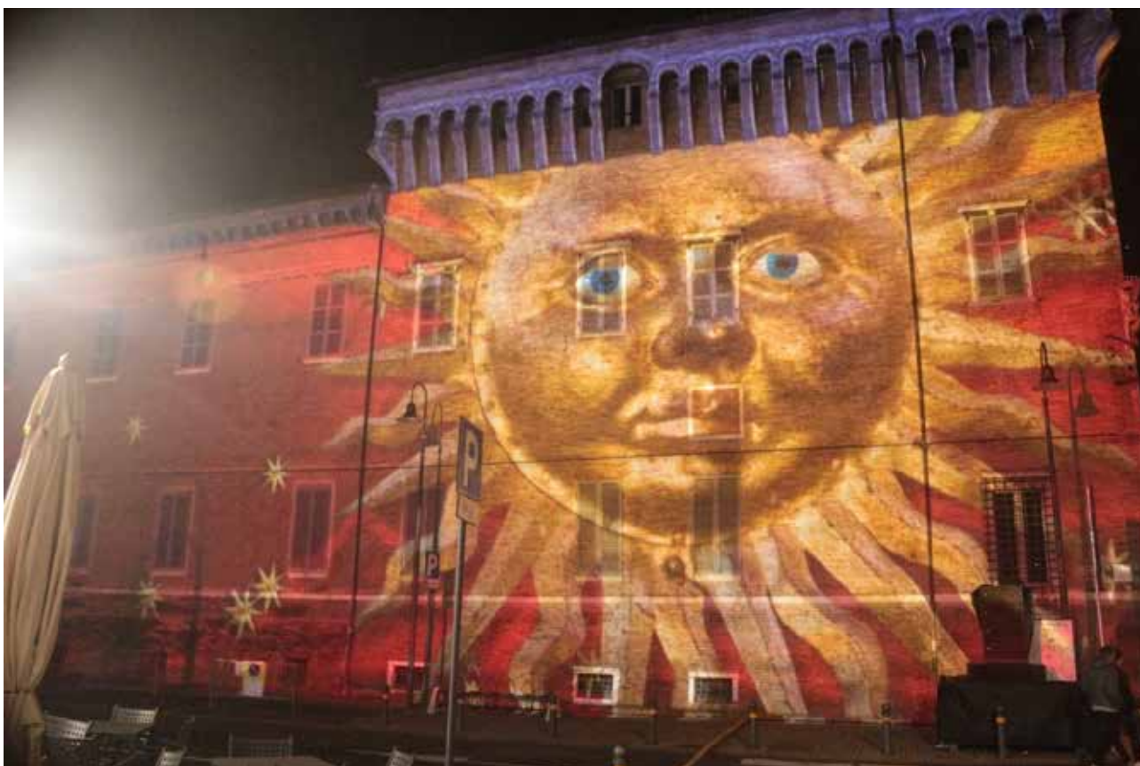
Illumination Luna projetée sur la place Kennedy de Ravenne, Italie Scénographes : Camille Gross et Olivier Magermans © Ville de Chartres - Groupement Martino © Camille Gross et Olivier Magermans