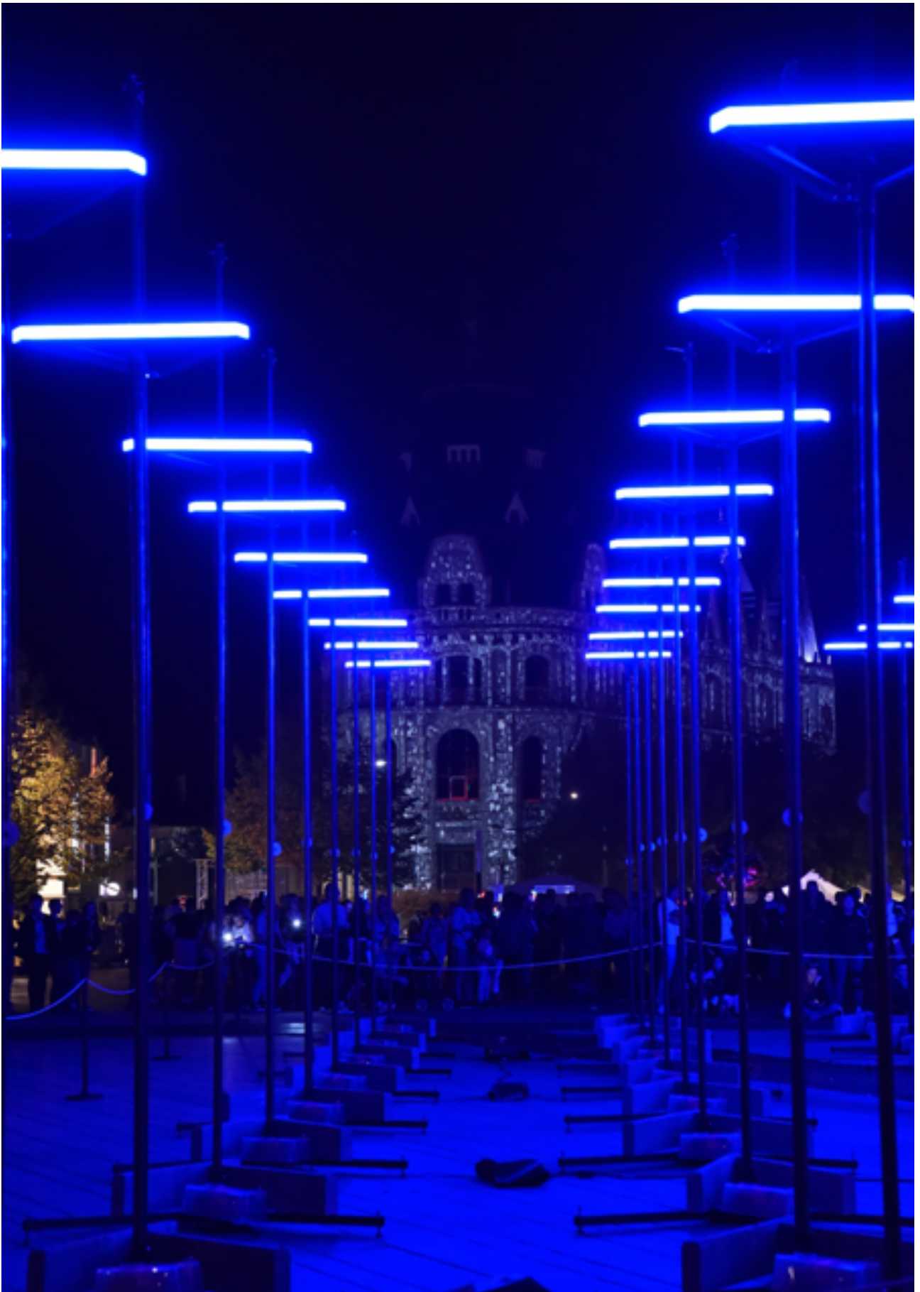
Abstract, Fête de la Lumière 2019 Compagnie : Collectif Coin