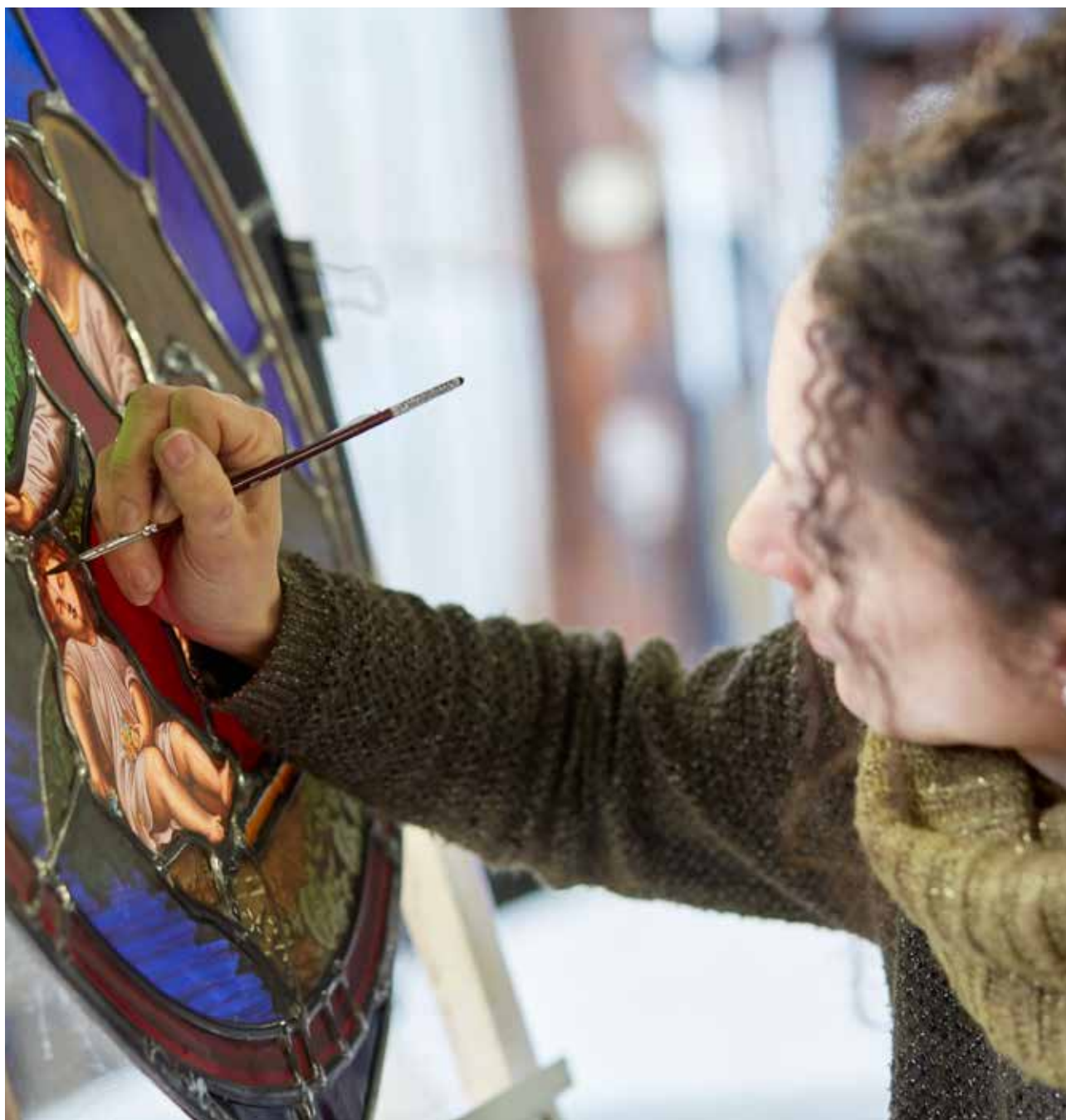
Les ateliers Lorin