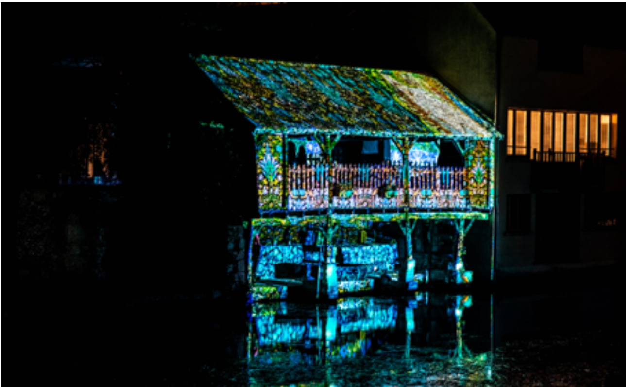
Lavoir Foulerie Scénographe : Studio graphique de la Ville de Chartres