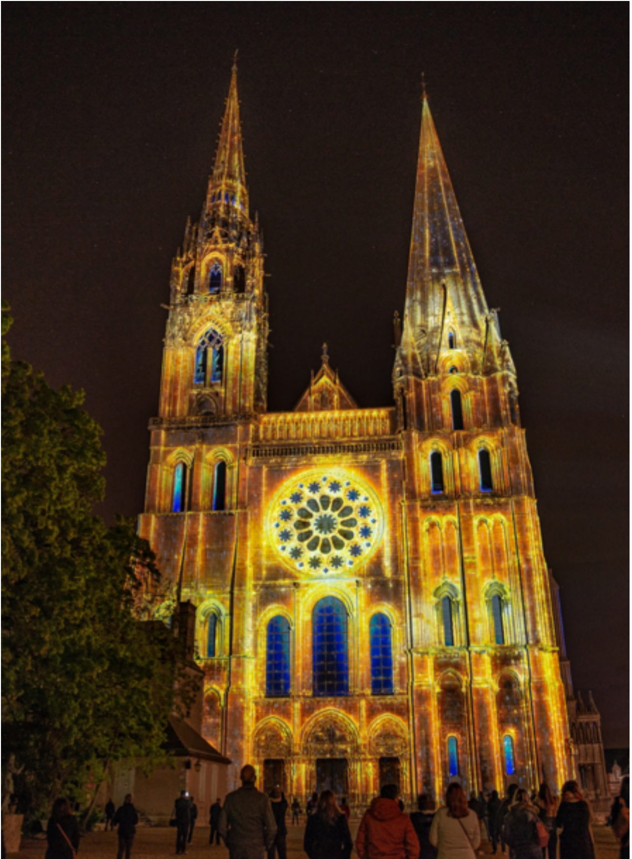
Portail royal de la cathédrale Scénographe : Spectaculaires, Allumeurs d'images © Ville de Chartres - Groupement Martino © Spectaculaires, Allumeurs d'images