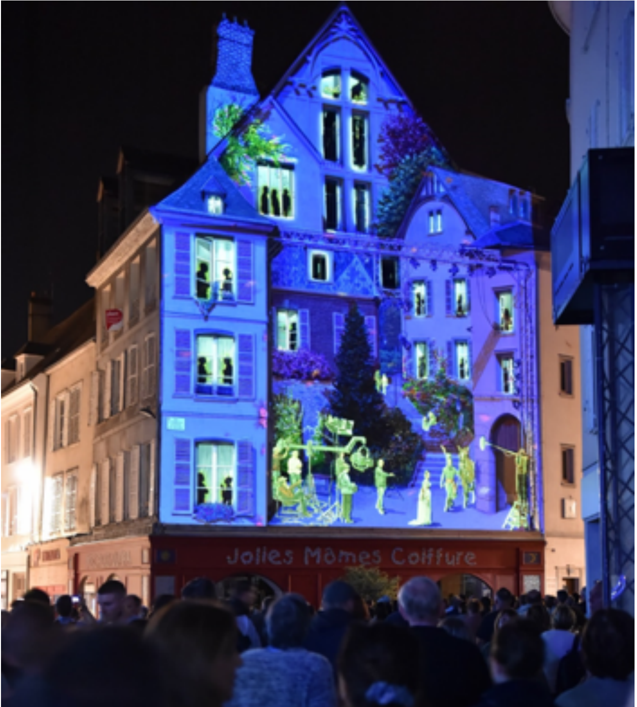
Fresque De-Lattre-de-Tassigny Scénographe : BK Digital Art Company © Ville de Chartres - Groupement Martino © CitéCréation © BK_Digital_Art_Company