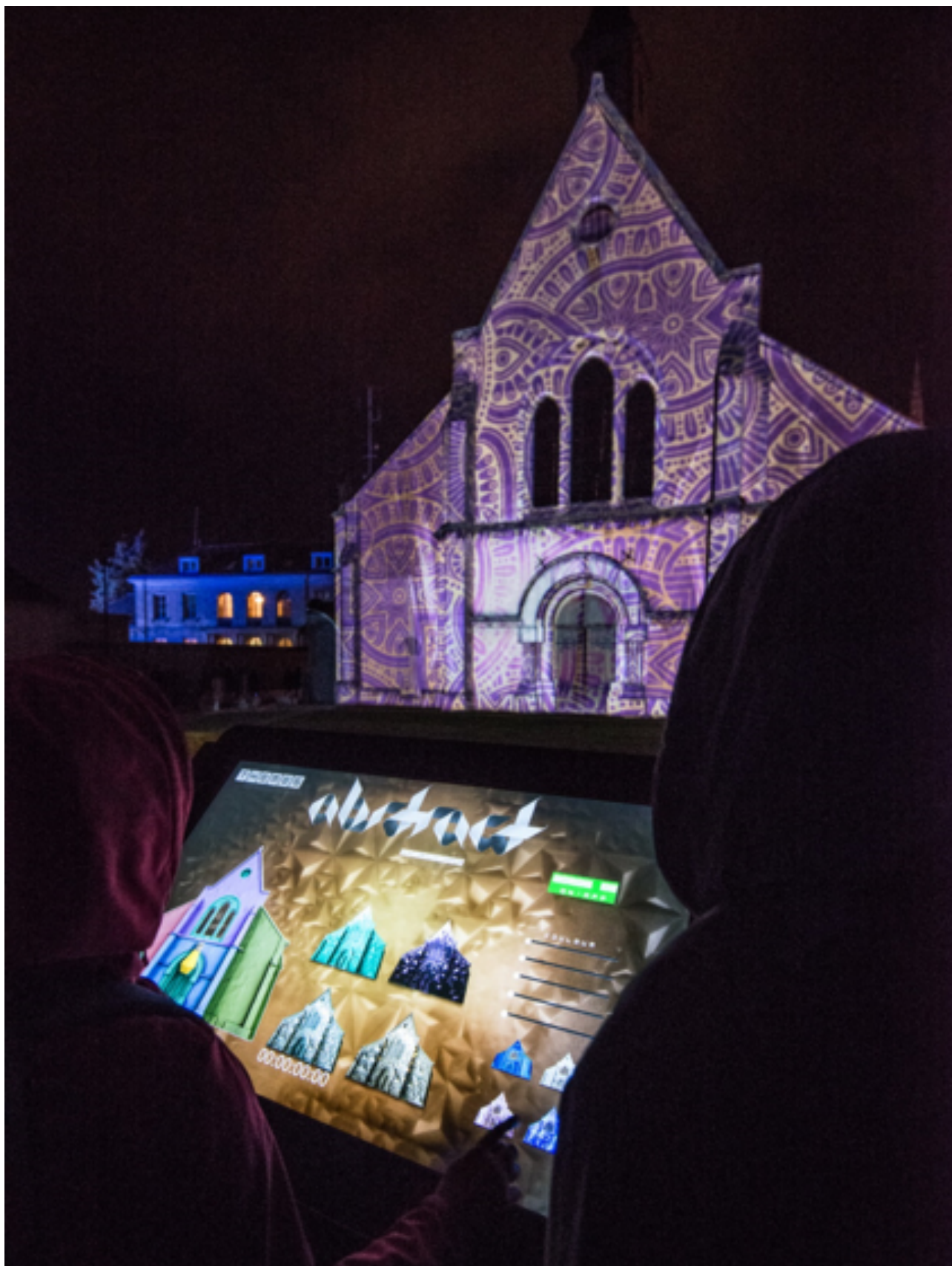
Table tactile permettant de contrôler l'illumination interactive de la chapelle Sainte-Foy Scénographe : Pixel'n'Pepper