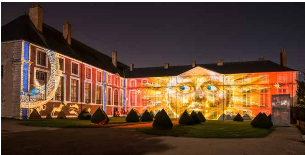
Illumination Luna des façades « jardins » du musée des Beaux-Arts Scénographes : Camille Gross et Olivier Magermans © Ville de Chartres - Groupement Martino © Camille Gross et Olivier Magermans