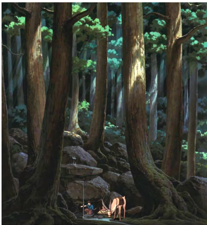
Ashitaka soulage sa blessure démoniaque (Ashitaka and Yakul in the forest), Projet de tapisserie de 5 x 4,60 m. © 1997 Studio Ghibli-ND