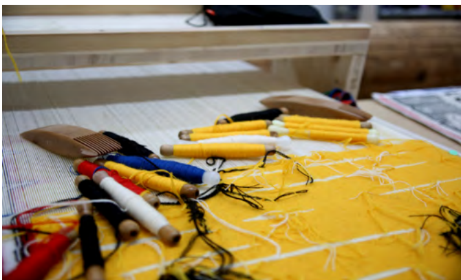
Tissage de la 10ème tapisserie de la tenture Tolkien