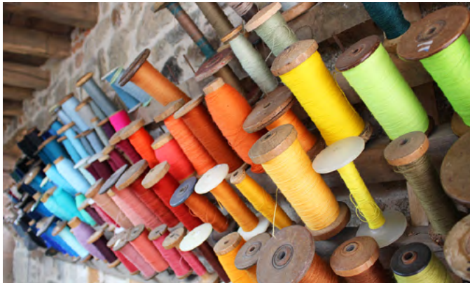
Bobines de laine