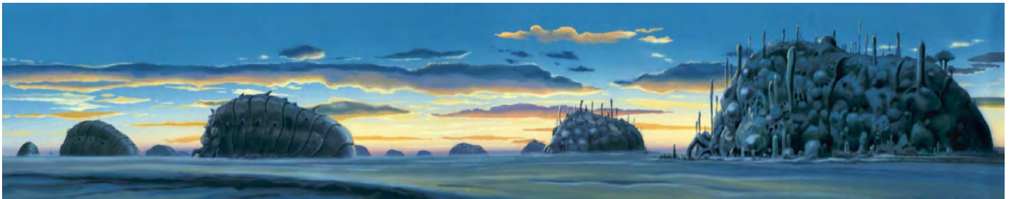
Le sacrifice des Omus (Panoramic view of the Omus), Projet de tapisserie de 2 x 10 m. © 2004 Studio Ghibli-NDDMT