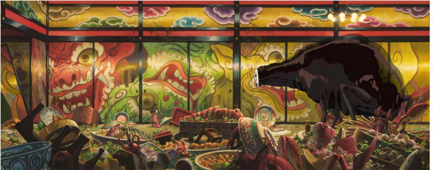
Le banquet du Sans visage (Chihiro presented to No Face), Projet de tapisserie de 3 x 7,50 m. © 2001 Studio Ghibli-NDDTM