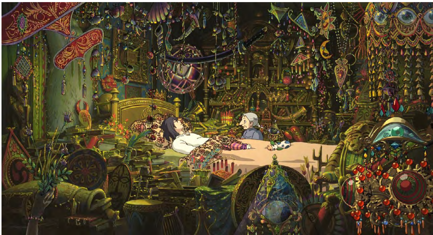
La peur de Hauru (Old Sophie at Howl's bedside), Projet de tapisserie de 3 x 5,60 m. © 2004 Studio Ghibli-NDDMT