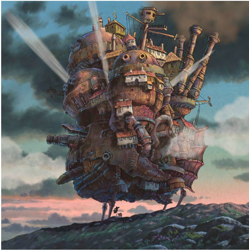
Le château ambulant (The Moving Castle at sunset) , Projet de tapisserie de 5 x 5 m. © 2004 Studio Ghibli-NDDMT